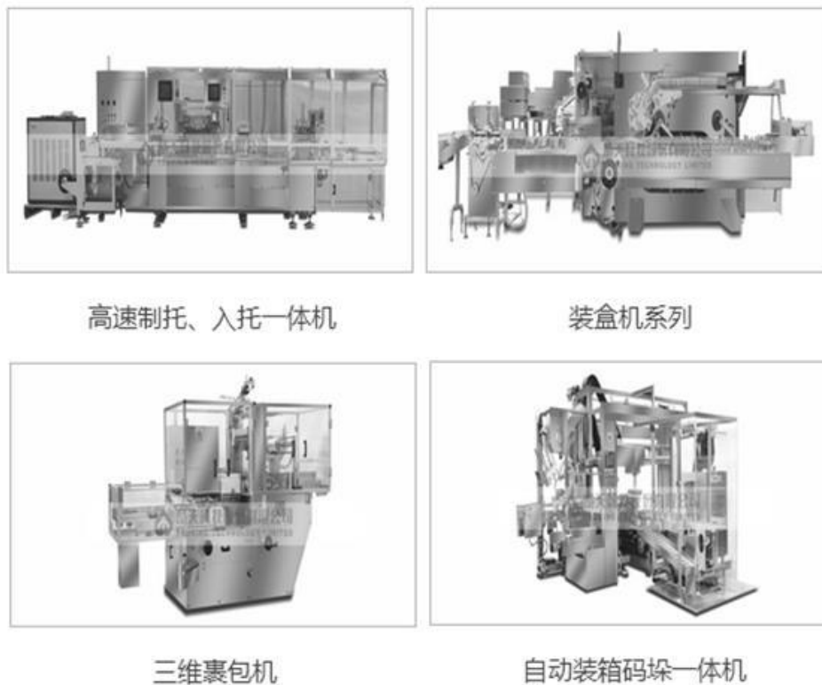
图：后包装工业机器人生产线系列

动化、高速化及智能化，为药品及食品工业的发展尤其是生物制药技术的应用及提高基本药物的质量提供良好的设备支持。